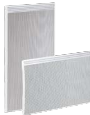
Gamme Stellio SAS

Les panneaux rayonnants auront une homologation CE, NF électricité performance Cat. C, classe II, IP 24, IK 08 Compatibles Vivrélec. Certification : Promodul, Promotelec