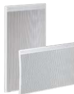
Gamme Stellio SAS